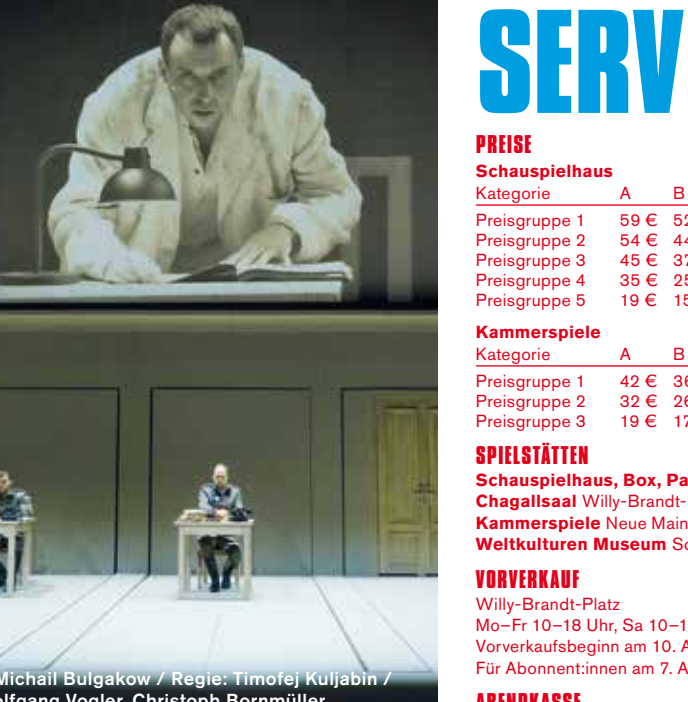
»Die Affäre auf der Straße nach Monaco / L'Affaire di via Monaco« / Text und Regie: Jan Koslowski, Nele Stuhler Miguel Klein Medina, Mark Tumba, Lia Saalmüller, Christoph Pütthoff, Nina Wolf, Melanie Straub

»In rund neunzig lebhaften Minuten verhackstückten Jan Koslowski und Nele Stuhler Straßen- und Theateralltag sowie die graue Gegenwart. [...] Die Frankfurtbezüge und -anspielungen sind mannigfaltig: Plank-Café und Kult-Kiosk Yok Yok, die Wiege der Demokratie und der Neubau der Theaterdoppelanlage am Willy-Brandt-Platz. Die wendigen Bühnenbilder von Chasper Bertschinger lassen manches davon auferstehen, mit viel Liebe fürs Detail. Das fabelhaft aufgelegte Ensemble bespielt seine Räume mit großspuriger Albernheit. [...] Diesmal gelingt ihnen (Jan Koslowski und Nele Stuhler) ein aufgekrazter Theateressay über Fragen der Stadtgesellschaft.« nachtkritik.de , 28. Februar 2026